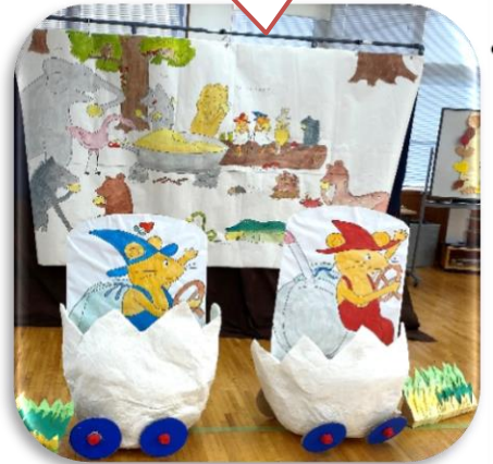
手遊びたのしいな