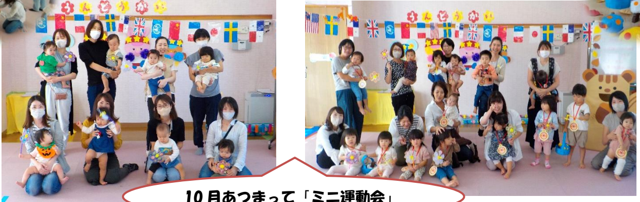
10月あつまって「ミニ運動会」