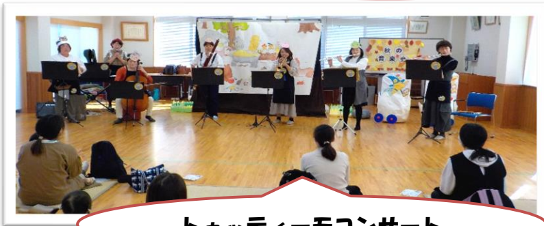
トゥッティモコンサート