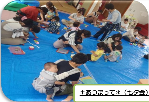
*あつまって* (七夕会)