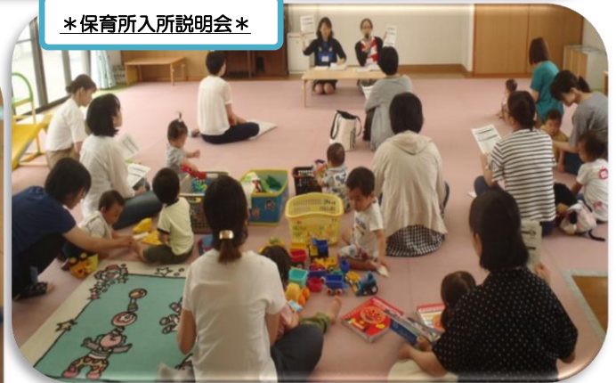
*保育所入所説明会*